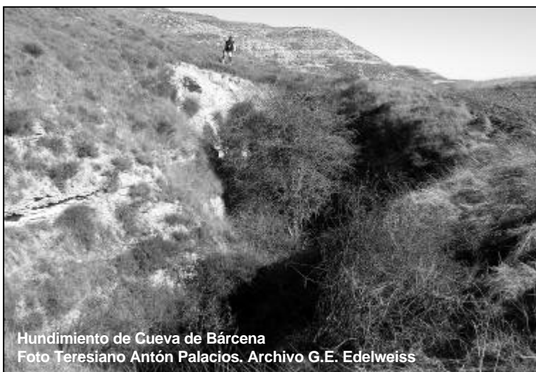
Hundimiento de Cueva de Bárcena

En el mes de agosto de 2007 se localizaron la cavidades descritas y en el mes de noviembre, en una segunda visita, ya se encontraban tapadas, presumiblemente por el