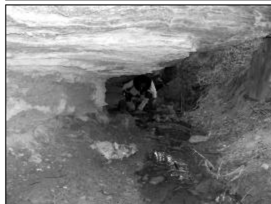
Cueva de Bárcena