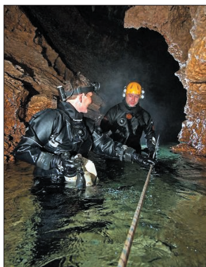
La burbuja Imagen tomada de Facebook campaña 2014 Foto Peter Goossens

www.facebook.com/pozoazul2014?ref=ts www.grupoedelweiss.com