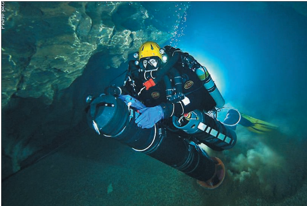
Rene en Sifón N°2