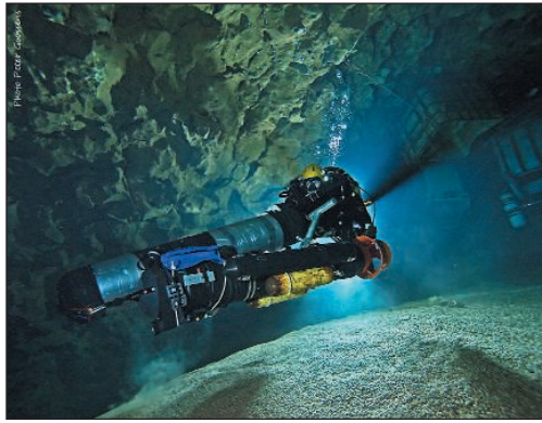
Rene en Sifón N°2 Imagen tomada de Facebook campaña 2014 Foto Autor desconocido