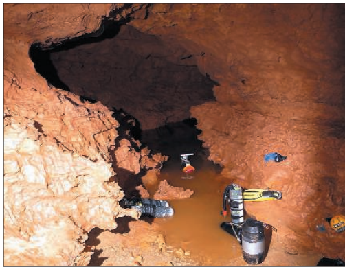
Inicio del Sifón N°3