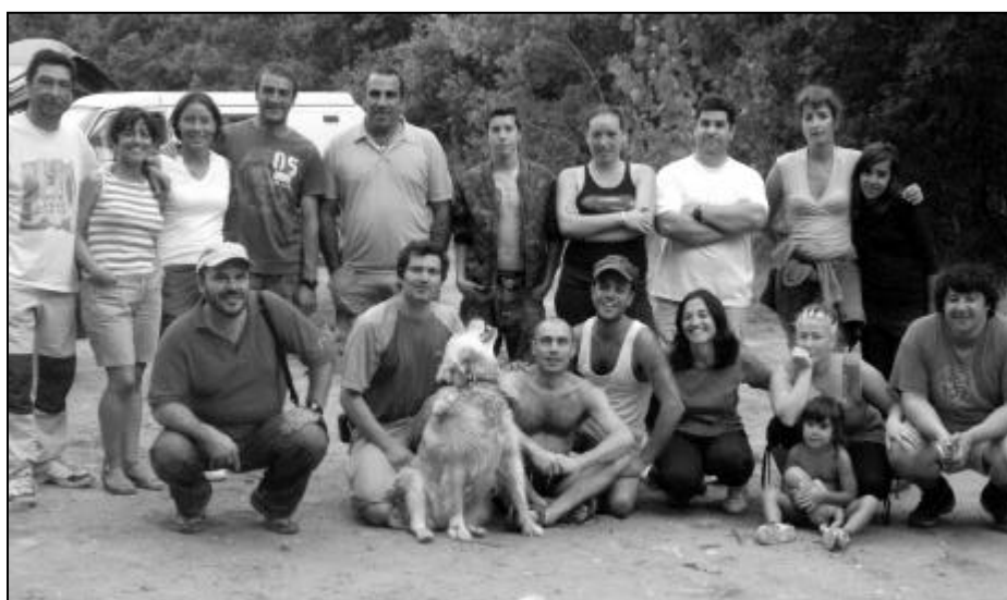
Una parte del equipo Fuente Azul 2007

Desde aquí el retorno ya no es cómodo. La corriente ha ido moviendo hacia fuera el sedimento levantado y la galería está bastante sucia. No puedo correr con el torpedo. Cuando llego al pozo en unos 210 metros, veo que no avanzo. No entiendo, paro el torpedo y lo vuelvo a conectar. No puedo subir. En seguida comprendo, me giro y veo el hilo guía enganchado a mi torpedo redun-