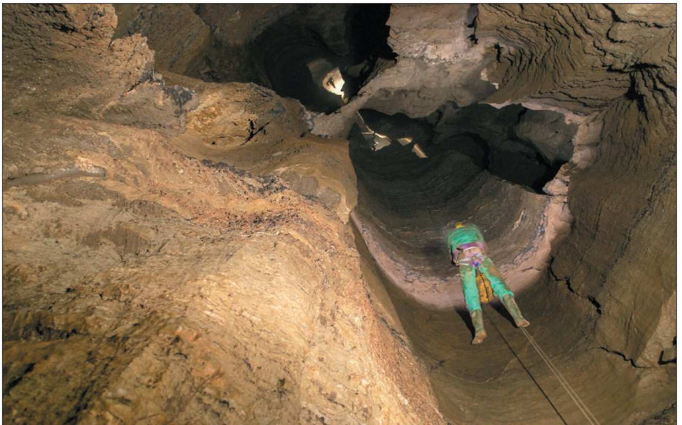
Pozo Corazón