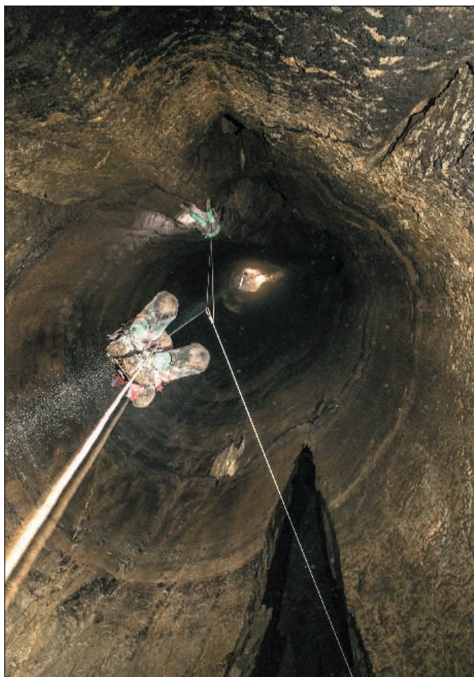
Pozo 4 Generaciones. V.142

cifra de 6Km de desarrollo topografiado y superando un desnivel de -318m. Esta labor se ha realizado por miembros del G. E. Edelweiss y del S.DOS.S., concentrando la práctica totalidad de las actividades realizadas en los Montes de Valnera.