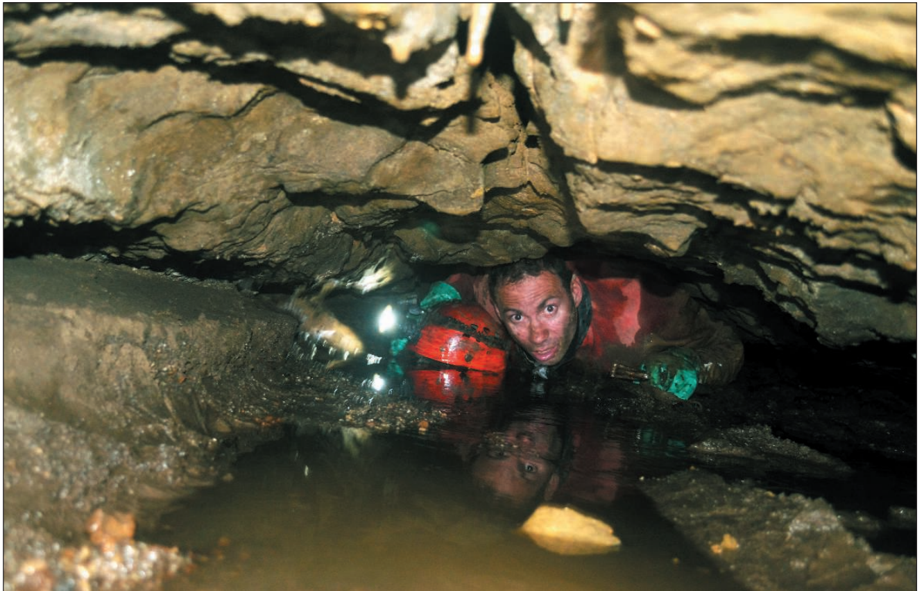
Gatera de acceso al Pozo Esperanza